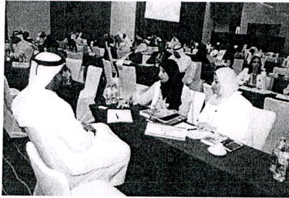
جانب من اجتماعات القمة الخليجية الاولى للمنح الدراسية في ابوظبي